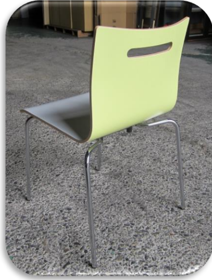
※表裏メラミン替え・取手穴付仕様